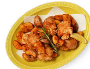
フライドポテト&チキン 自家栽培のローズマリー風味 1,380yen