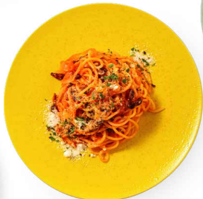
アマトリチャーナ 2,080yen