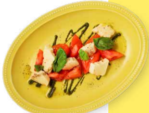
淡路島産トマトと自家栽培バジルの カプレーゼ 1,380yen