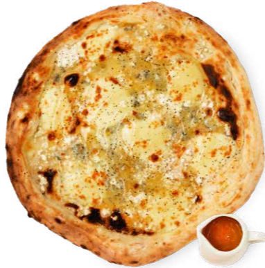
オーガニックはちみつ クアトロフォルマッジ 1,980yen