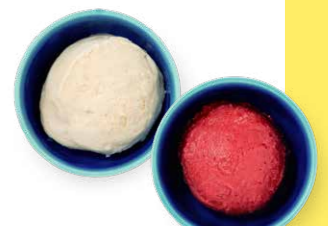
自家製 ヴィーガンジェラート (オーツミルク/ストロベリー) 680yen