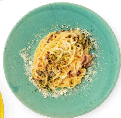
北坂たまごの カルボナーラ 2,200yen