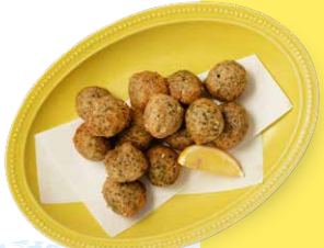
自家製アオサの ゼッポリーニ 680yen