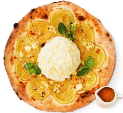
島レモンと自家製はちみつレモンの リモーネフォルマッジ 1,980yen