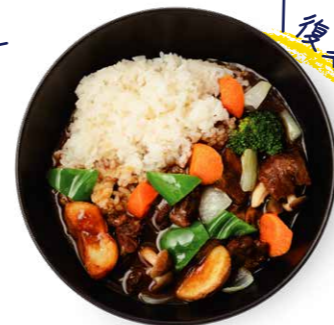
淡路牛はちみつカレー 1,680yen