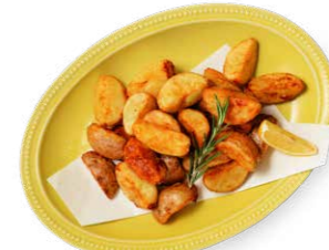
フライドポテト 自家栽培のローズマリー風味 880yen