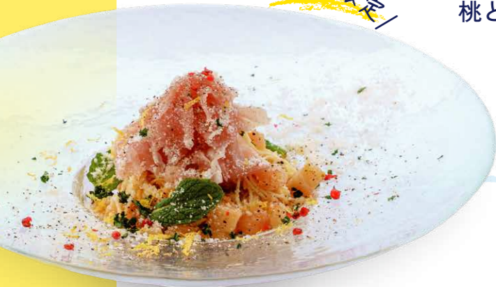
桃と生ハムの カッペリーニ 2,200yen