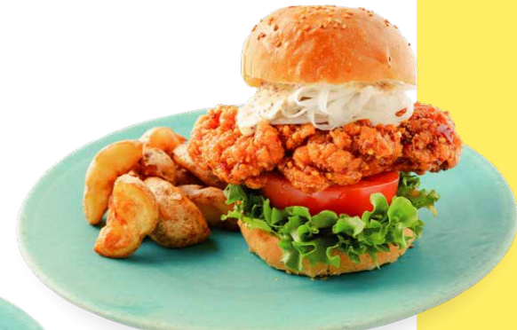
ハニーマスタード フライドチキンバーガー 2,200yen