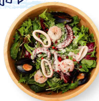
シーフードサラダ 2,500yen