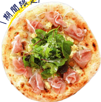
桃と生ハムのピザ 2,200yen