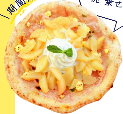
桃かけ放題 クリームチーズピザ 3,850yen