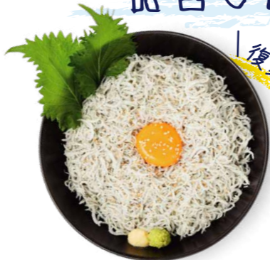
淡路島釜揚げしらす丼 1,580yen