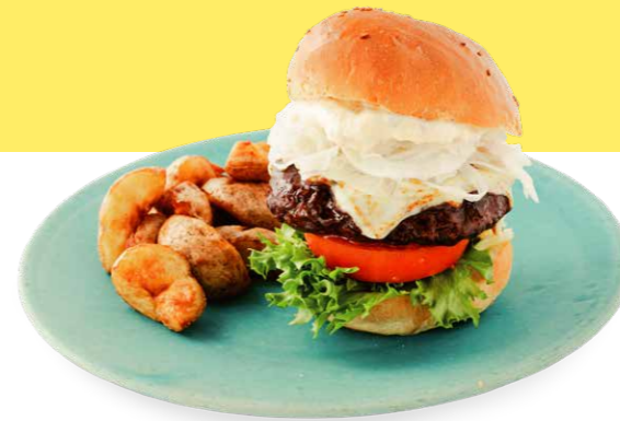
淡路牛プレミアムバーガー 2,000yen